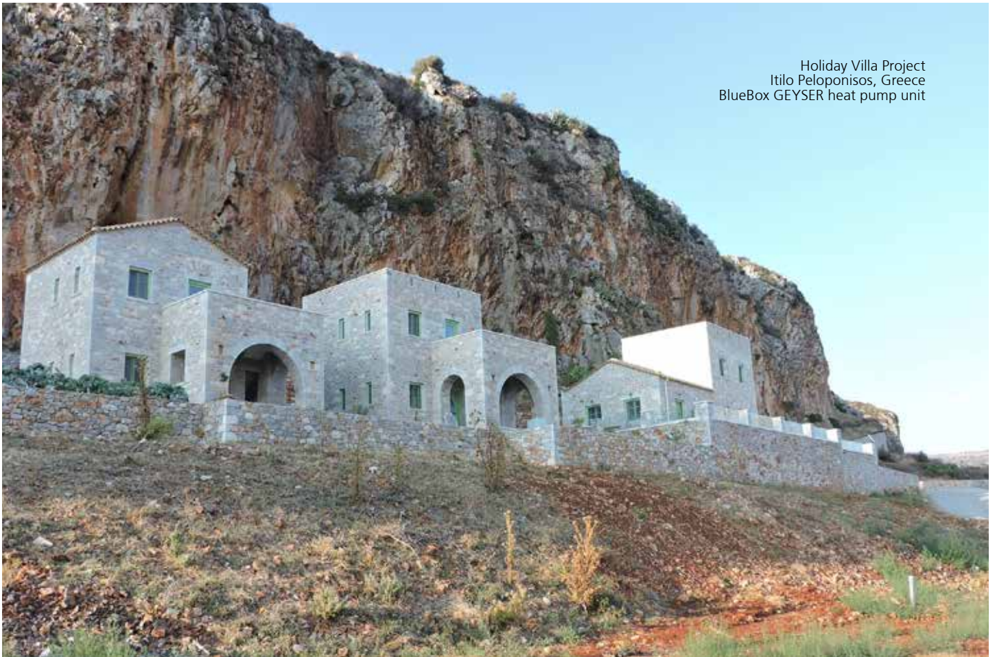
Holiday Villa Project Itilo Peloponisos, Greece BlueBox GEYSER heat pump unit